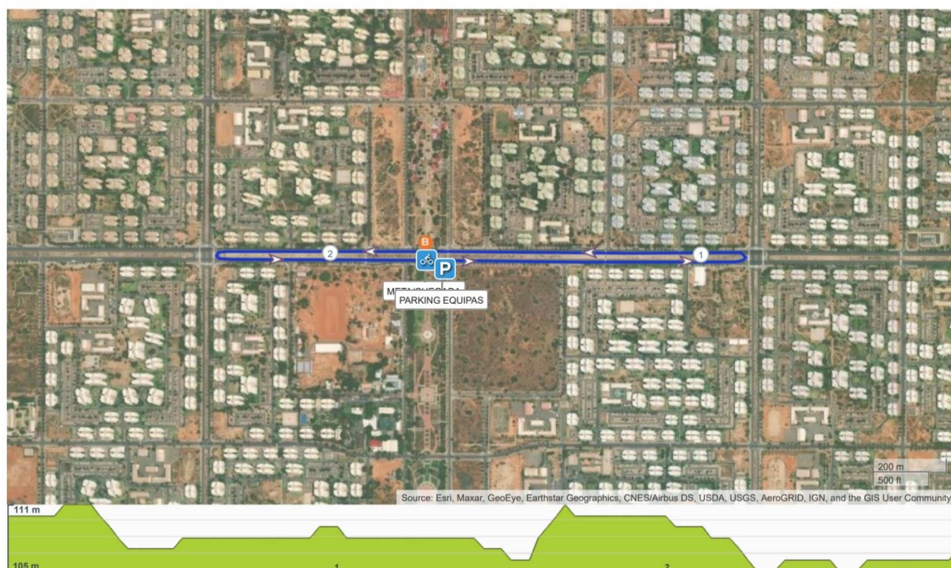
Percorso Etapa 2 - Acumulado 11m